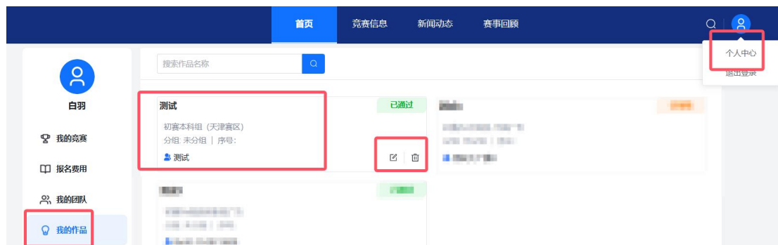
图 16 作品编辑