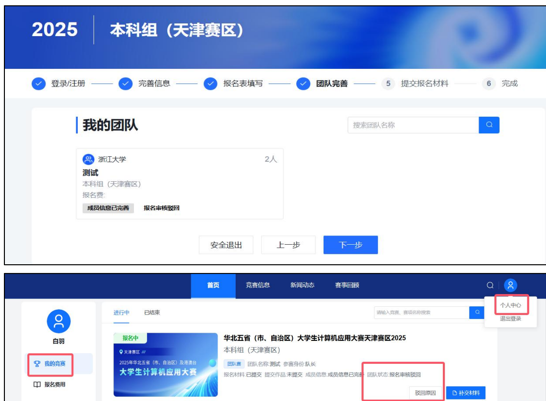
图 12 报名表审核失败页面