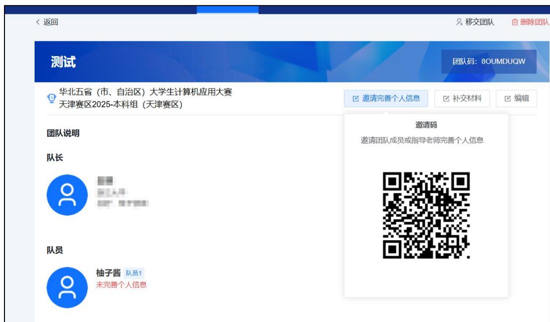
图 8 团队详情

未完善成员和老师也可以打开竞赛官网： http://bjcac.buu.mooccollege.com/ ，登录；