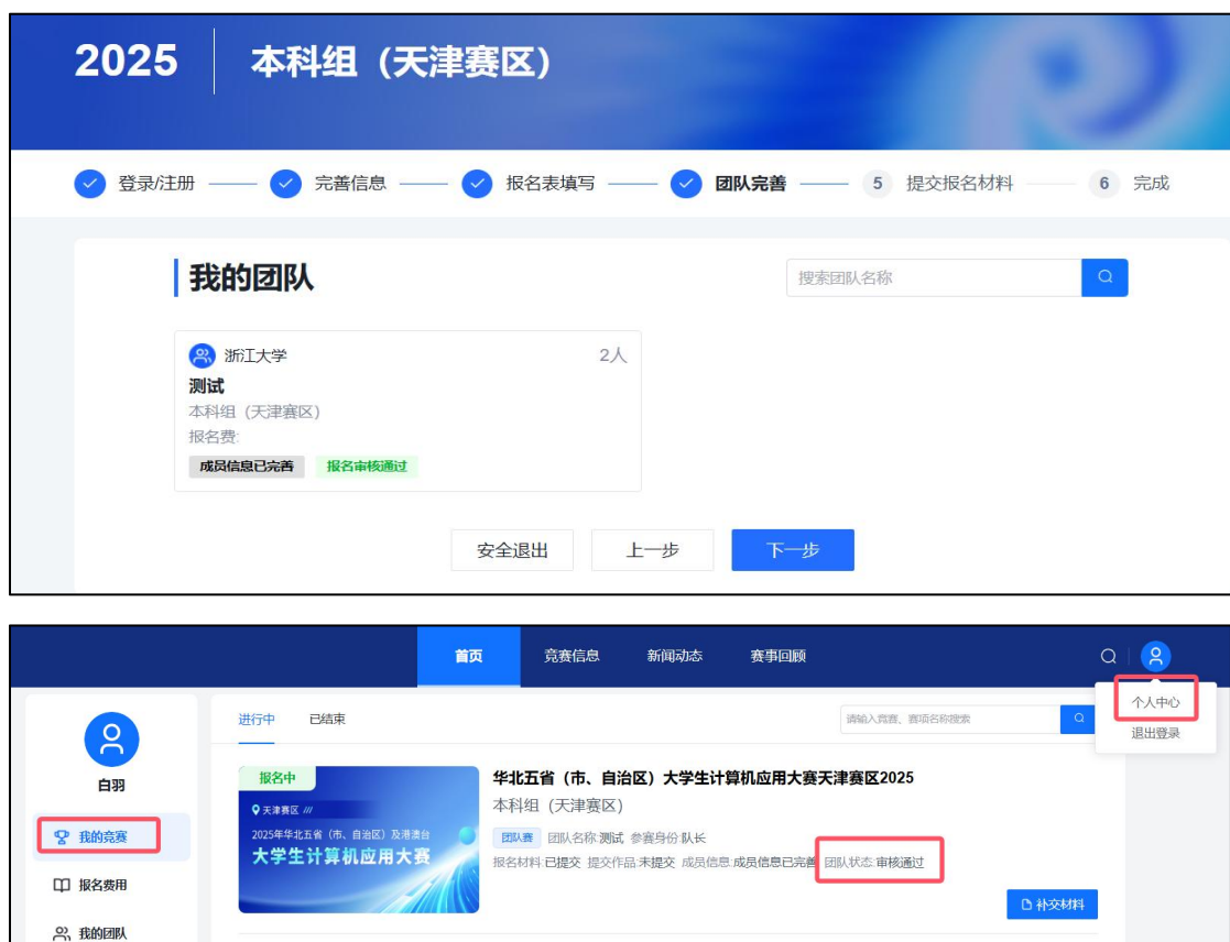
图 13 报名表审核成功页面