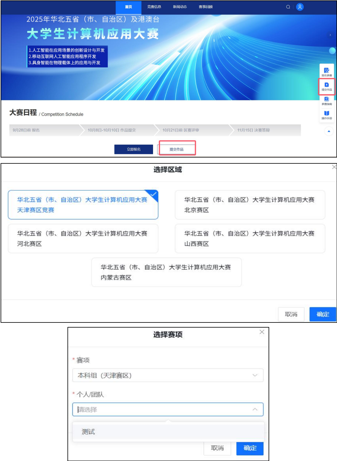
图 14 提交作品

1.队长在官网首页【上传作品】或者【提交作品】入口—区域—参赛赛项（参赛类别和队伍名称）—进入，（团队状态显示“报名成功”才能提交作品），如图 14